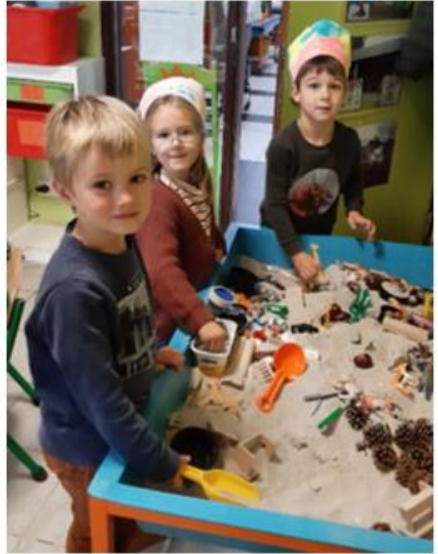
SPELEN IN DE ZANDBAK