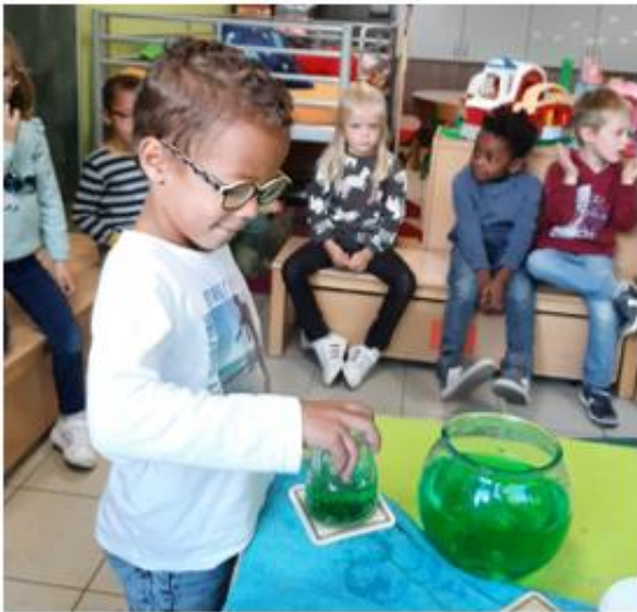
PROEFJES MET WATER