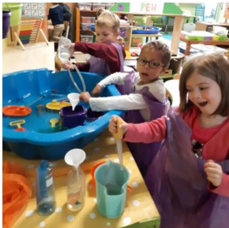
VULLEN EN GIETEN