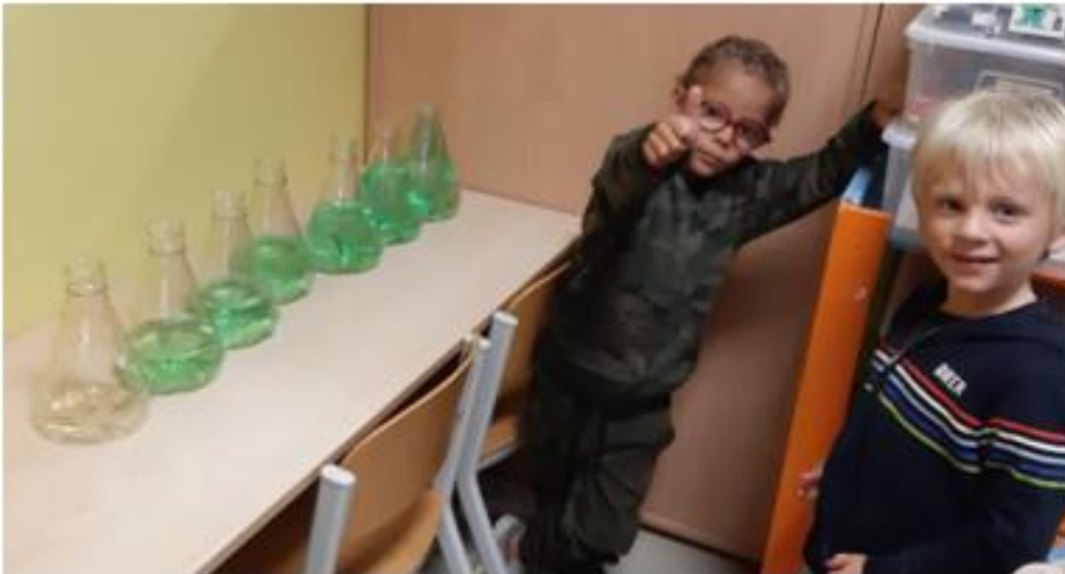
VAN LEEG NAAR VOL