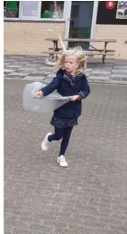
SPELEN MET LUCHT